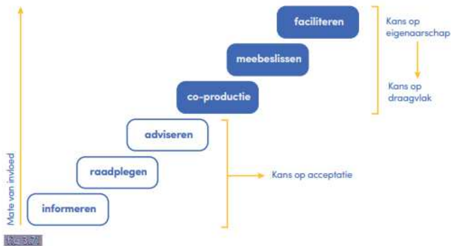
Figuur 1: participatieladder