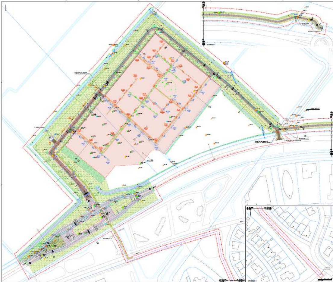
afbeelding 3 infrastructuur openbaar gebied

De ontwerpbesluiten liggen vanaf 17 december 2025 voor een periode van 6 weken ter inzage. Hierna wordt beoordeeld of eventuele zienswijzen aanleiding geven tot aanpassingen. Dan volgt de vaststelling van het definitieve besluit. De omgevingsvergunning treedt inwerking de dag na bekendmaking. Wel loopt dan nog een beroepstermijn van 6 weken. Tegen het besluit staat zowel beroep als later nog hoger beroep open.