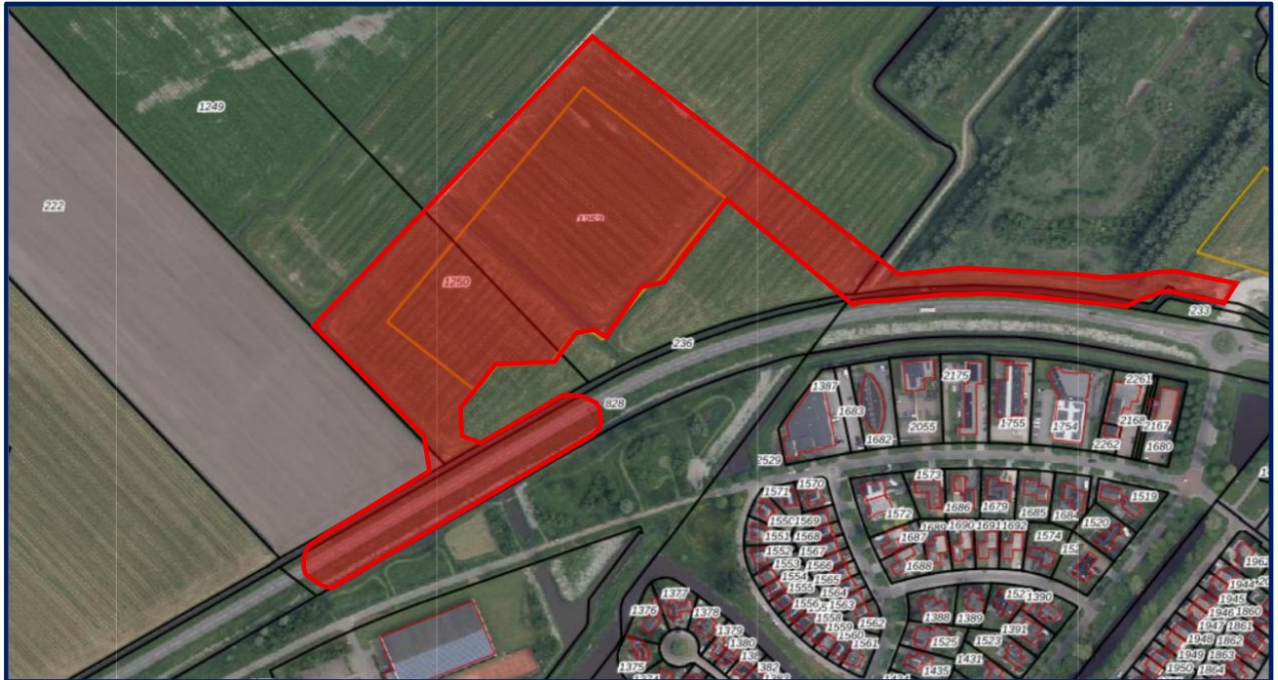
afbeelding 1 plangebied opvanglocatie en omliggende openbare infrastructuur

Om aan onze maatschappelijke verantwoordelijkheid én aan de Spreidingswet te voldoen, was er een nieuwe locatie nodig. Hierbij is voor Harinxmaland gekozen omdat dit kansen bood voor een nieuwe duurzame opvanglocatie, passend bij de nieuwe woonontwikkeling die daar gepland is.