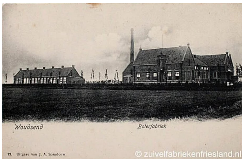
Figuur 1, voormalige arbeiderswoningen

Op 5 juni 1971 is een verzoek ingediend voor het gebruik van Vosseleane 27 t/m 37 als recreatiewoningen (voormalige arbeiderswoningen van de zuivelfabriek, zie figuur 1). Op 17 juni van hetzelfde jaar is deze brief positief beantwoord door de toenmalige gemeente Wymbritseradeel.