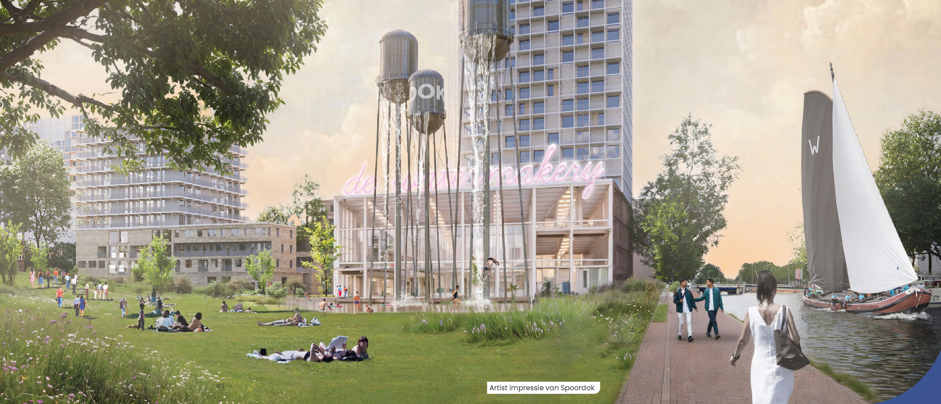
Artist impressie van Spoordok