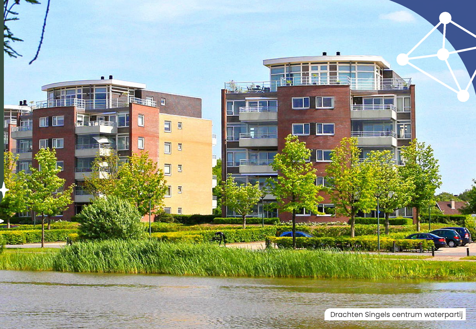
Drachten Singels centrum waterpartij