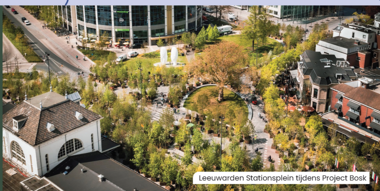
Leeuwarden Stationsplein tijdens Project Bosk

Met de aanleg van de Lelylijn, met ook Leeuwarden als begin- en eindstation, verbeteren we de onderlinge bereikbaarheid van de F4 aanmerkelijk en kunnen we extra profiteren van de nabijheid van Groningen, Lelystad en de Randstad. We worden een integraal onderdeel van de 'second tier stedenband'. We concentreren ons op de grootschalige woningbouwlocaties in de F4, direct nabij bestaande en nieuwe stations ('15 minutenstad').