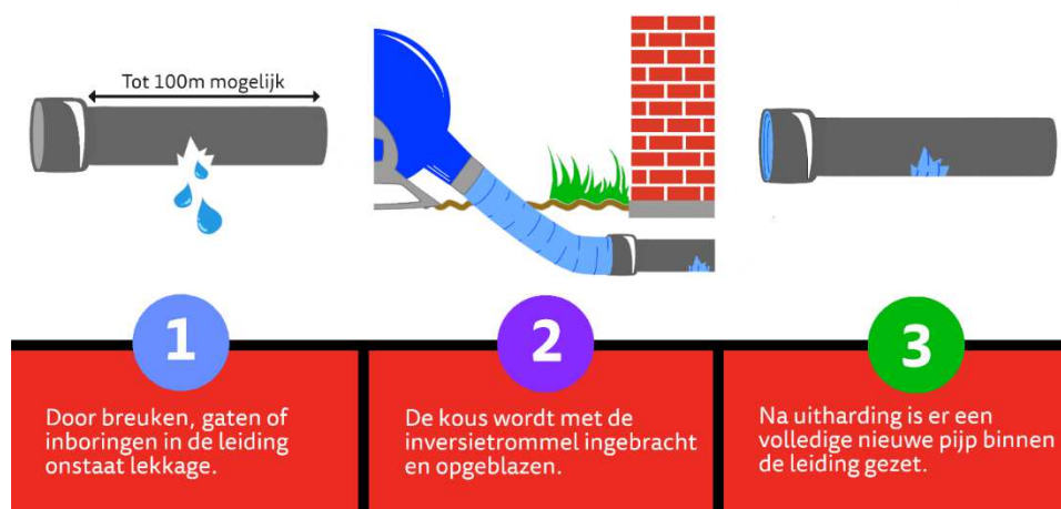
Fig 2 het principe van relinen

Voor de stimulering van klimaatadaptieve maatregelen heeft het rijk de ‘Tijdelijke Impulsregeling klimaatadaptatie 2021 - 2027’ ingesteld. Het gaat hierbij om maatregelen die wateroverlast en de gevolgen van droogte en overstromingen beperken of voorkomen. De gemeente heeft voor 6 projecten een ‘Impuls bijdrage’ toegezegd gekregen. Binnenkort zal uw college en de raad hierover geïnformeerd worden.