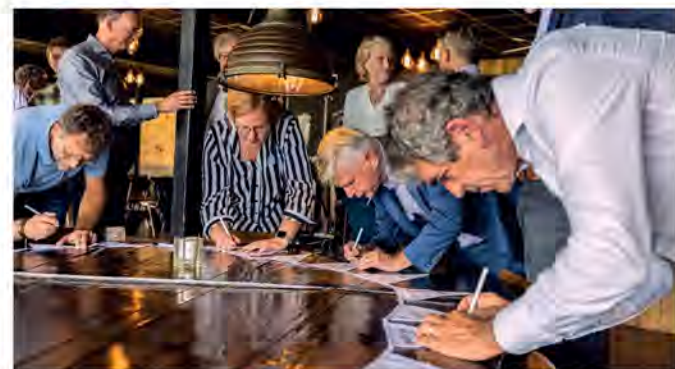
12 september 2023: partners benoemen prioriteiten en proosten samen op de regionale samenwerking

Terherne); regionale ondernemers (Ondernemersnetwerk Gaasterland, VVB Lemsterland, Ondernemersver.Skarsterlân, Ondernemersfed. SWF, VOS, Van Wijnen Noord, Beneteau Group, Vripack Sneek, Boschma Cases Lemmer); natuur- en landschapsorganisaties (It Fryske Gea, Landschapsbeheer Friesland); recreatie (VVV Waterland van Friesland, Toerisme Alliantie Fryslân); innovatie Innovatiepact Fryslân (economic board, triple helix); mobiliteit (Freonen (vrienden) fan Fossielvrij Fryslân).