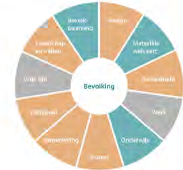
Bron: PBL, mei 2023

Deze plussen komen terug in onze opgaven: het in stand houden en versterken van de Mienskip en het bewaken van ons prachtige landschap. We zetten hiermee in op het vasthouden van onze kwaliteiten.