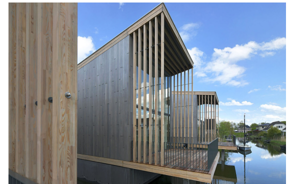
Afbeelding 4: Terrassen zijn mee-ontworpen