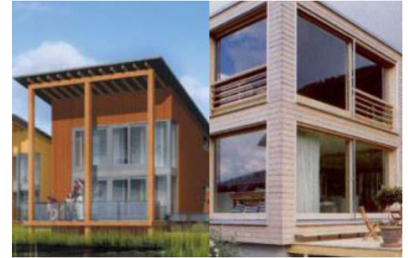
Afbeelding 2: een transparante voorgevel, met veel glas