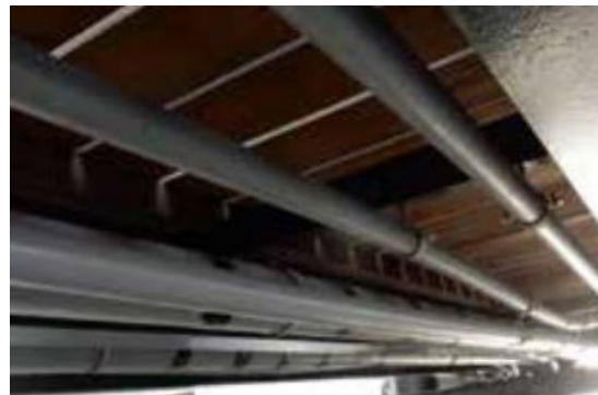
Afbeelding 3: nutsleidingen zijn geïntegreerd in de steigers in aansluiting op de oever.