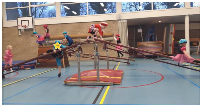
in gymzaal Witmarsum