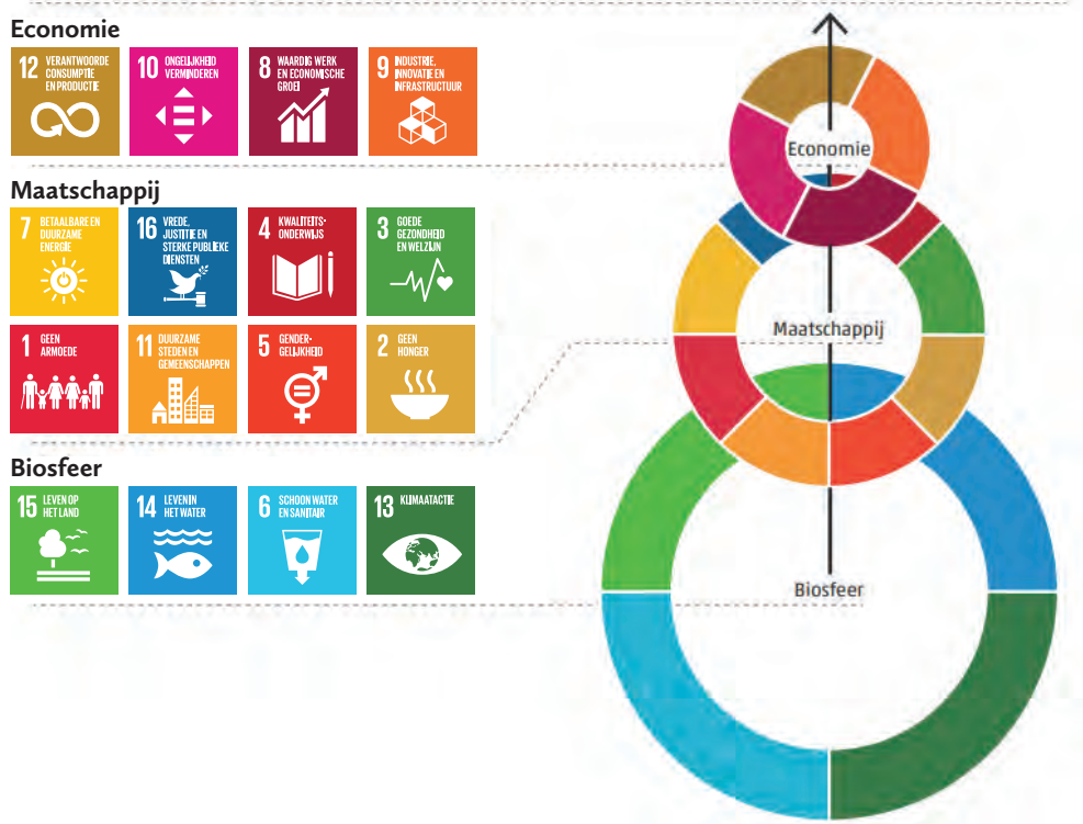
Figuur 1: Overzicht duurzame ontwikkelingsdoelen per dimensie

Súdwest-Fryslân is een zogeheten Global Goals gemeente. Dat houdt in dat we ons gecommitteerd hebben aan de duurzame ontwikkelingsdoelen die zijn vastgesteld door de Verenigde Naties. We willen op gemeentelijk niveau ons steentje bijdragen aan mondiale vraagstukken. De duurzame ontwikkelingsdoelen fungeren als ons kompas in onze inzet, ook als het gaat om de ontwikkeling van onze economie. Er zijn in totaal 17 duurzame ontwikkelingsdoelen die zijn onder te verdelen in drie dimensies: economie, maatschappij en biosfeer.