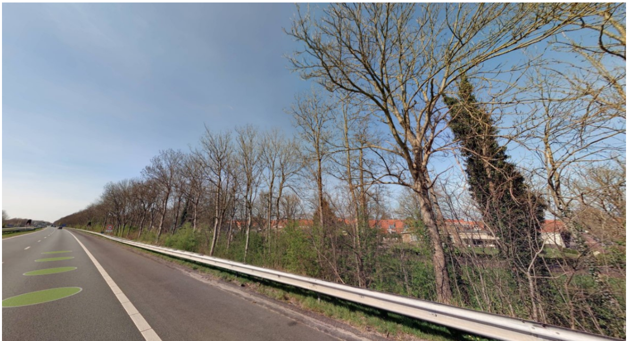
Berm A7 ter hoogte van Burgemeester Praamsmalaan Bolsward

Om een geluischerm te plaatsen is grondwerk nodig. Dan zal zeker bestaand groen verwijderd moeten worden. Het bestaande groen bestaat voor een groot deel uit omhooggeschoten bosschage. Het gaat minder om bewust aangeplante waardevolle bomen.